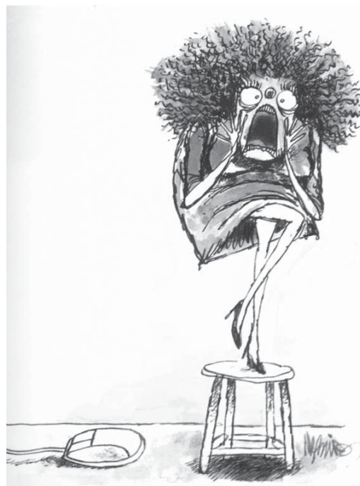
NEGREIROS apud DIMENSTEIN, Gilberto. Aprendiz do futuro: Cidadania hoje e amanhã. São Paulo: Ática, 1999. p.11

Os instrumentos de comunicação se multiplicam, mas o potencial de captação do homem — do ponto de vista físico, mental e psicológico — continua restrito. Então, diante do bombardeio crescente de informações, a reação de muitos tende a tornar-se doentia: ficam estressados, perturbam-se e perdem a eficiência no trabalho.